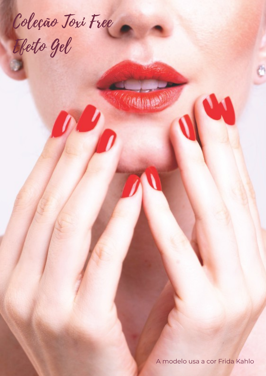
A modelo usa a cor Frida Kahlo