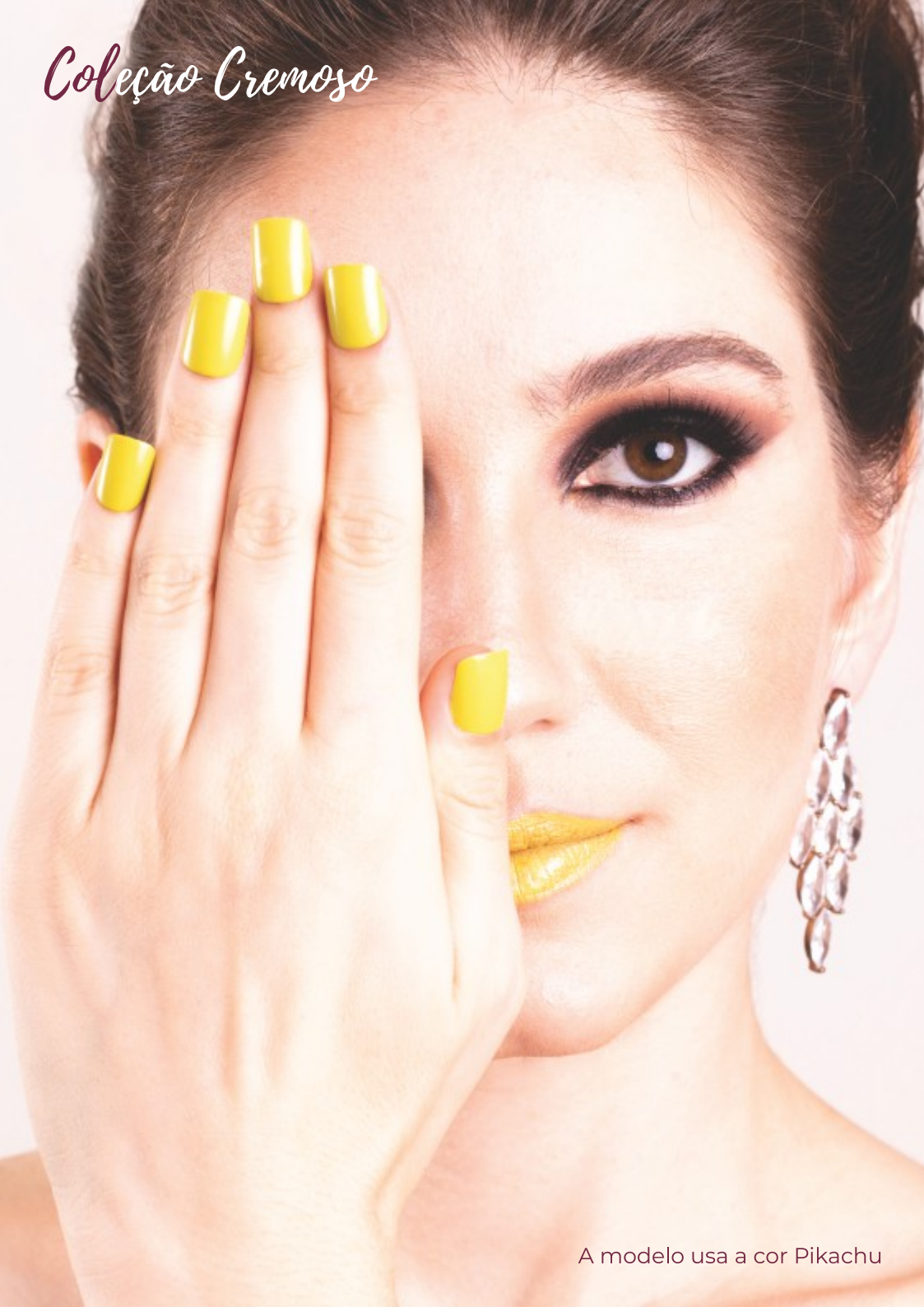
A modelo usa a cor Pikachu