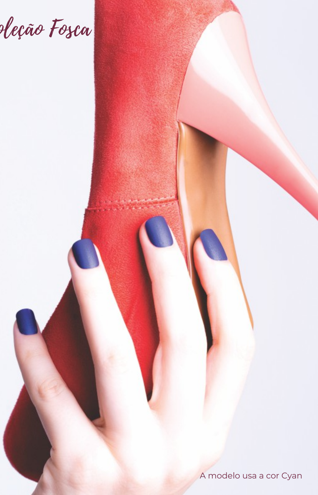
A modelo usa a cor Cyan