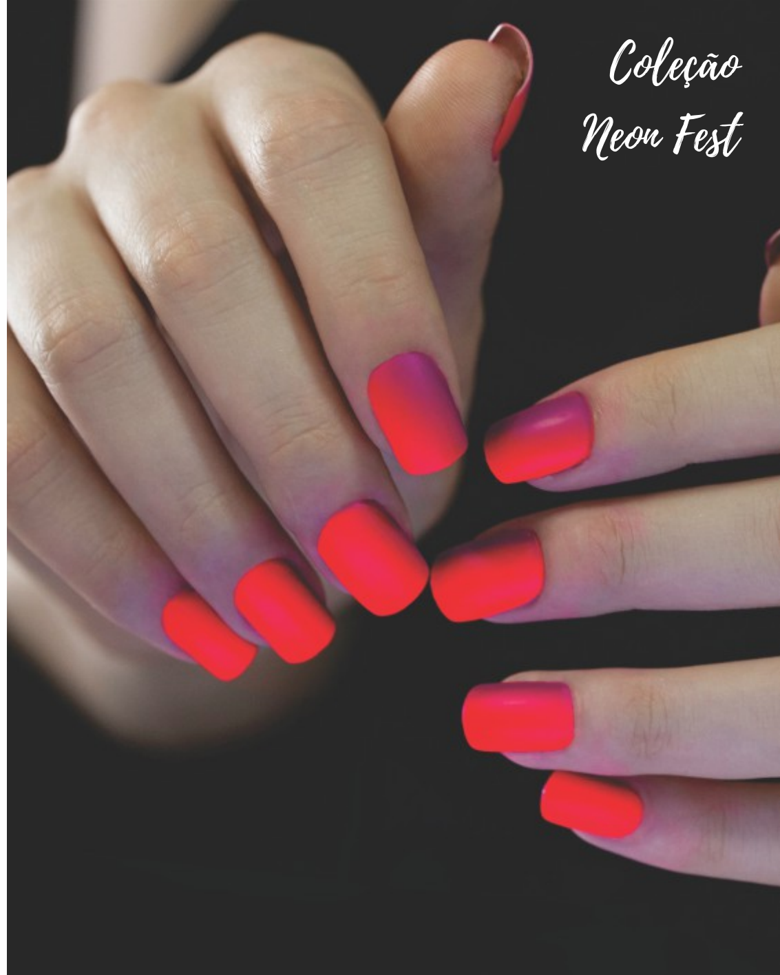
A modelo usa a cor Rosa Neon