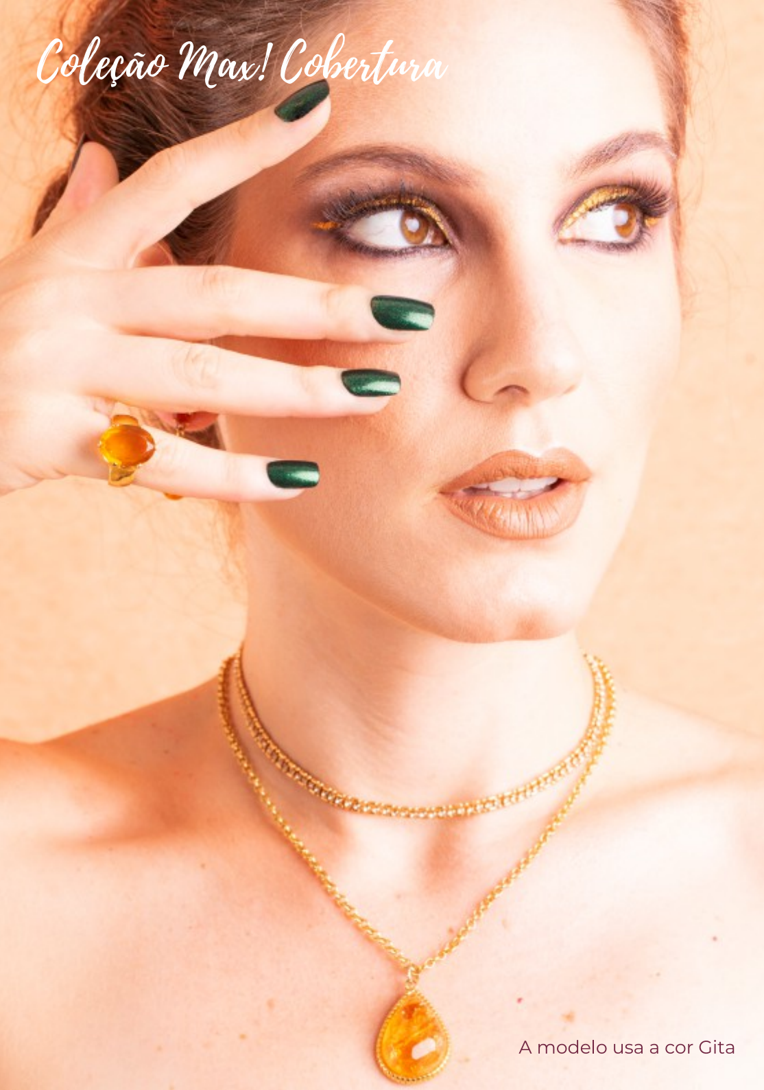
A modelo usa a cor Gita